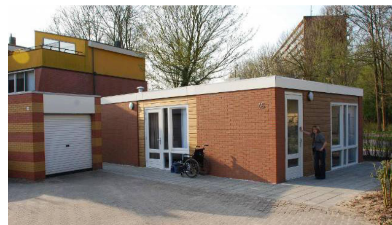
Voorbeeld van een mantelzorgwoning.