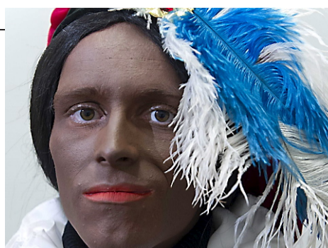
Zwarte Piet wordt saaie Piet

De nieuwe Zwarte Piet heeft geen kroeshaar en volle rode lippen meer, is niet meer zwart maar bruin en zijn pak is wat hipper geworden. Ook draagt het hulpje van Sinterklaas geen oorkingen meer. Verder zou Zwarte Piet een meer gelijkwaardige relatie met Sinterklaas moeten hebben en minder dom moeten zijn. Het Nederlands Centrum voor Volkscultuur en Immaterieel Erfgoed (VIE) presenteerde dinsdagavond na onderzoek deze 'nieuwe Zwarte Piet'. Kortom, alles wat Piet onderscheidt, grappig en daarom leuk maakt voor kinderen wordt weggepoetst. Deze nieuwe Zwarte Piet is vooral een saaie Piet.